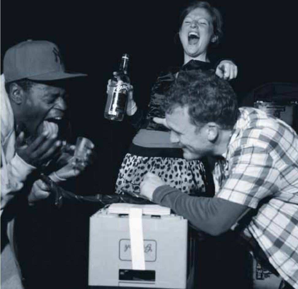
Under Pressure, Forumtheater voor het voortgezet onderwijs