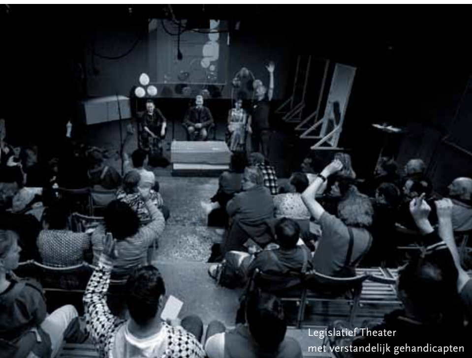
Legislatief Theater met verstandelijk gehandicapten

Formaat is een organisatie die werkt aan empowerment van mensen in een achterstandspositie, participatie van mensen die onvoldoende aan de samenleving deelnemen, bewustwording van mensen m.b.t. mensenrechten, grondrechten en waarden & normen en dialoog tussen burgers onderling c.q. tussen burgers en overheid. Formaat doet dit door middel van allerlei vormen van Participatief Drama.